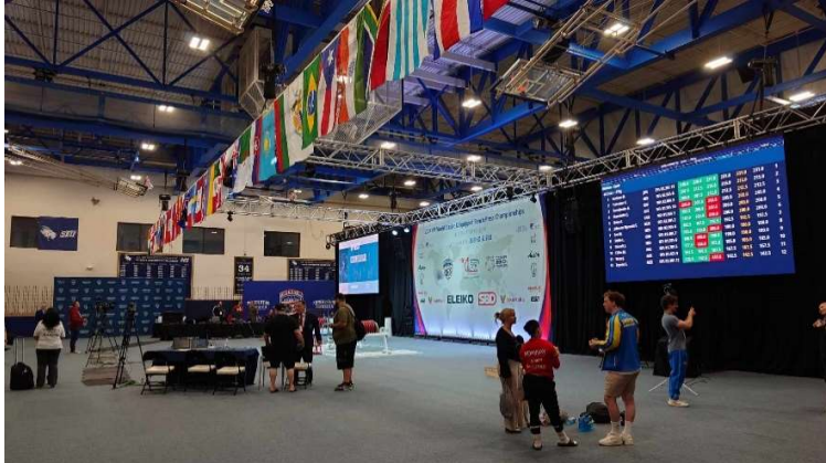
Foto af stævnehallen.

Stævnet bliver afholdt i en ekstremt nedkølet sportshal på St. Edward's University, men ellers med ganske udmærkede faciliteter i form af ti Eleikoracks i opvarmningen og mulighed for daglig træning i Eleikos faciliteter, som ligger lige i nærheden.