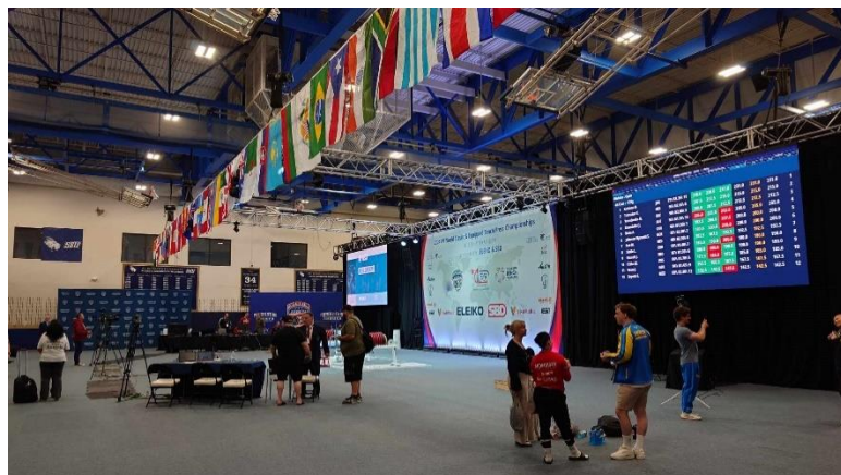
Foto af stævnehallen.

Stævnet bliver afholdt i en ekstremt nedkølet sportshal på St. Edward's University, men ellers med ganske udmærkede faciliteter i form af ti Eleikoracks i opvarmningen og mulighed for daglig træning i Eleikos faciliteter, som ligger lige i nærheden.