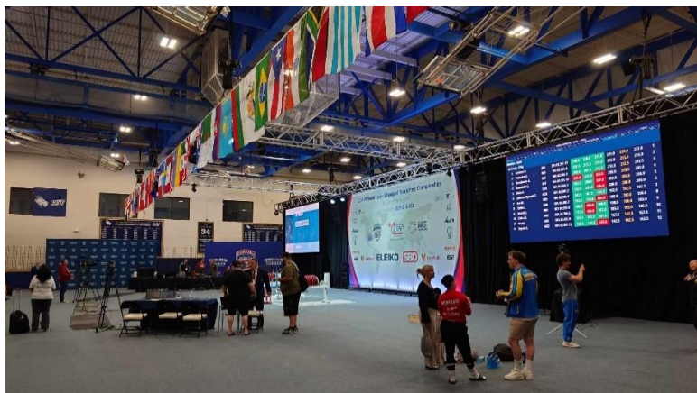
Foto af stævnehallen.

Stævnet bliver afholdt i en ekstremt nedkølet sportshal på St. Edward's University, men ellers med ganske udmærkede faciliteter i form af ti Eleikoracks i opvarmningen og mulighed for daglig træning i Eleikos faciliteter, som ligger lige i nærheden.