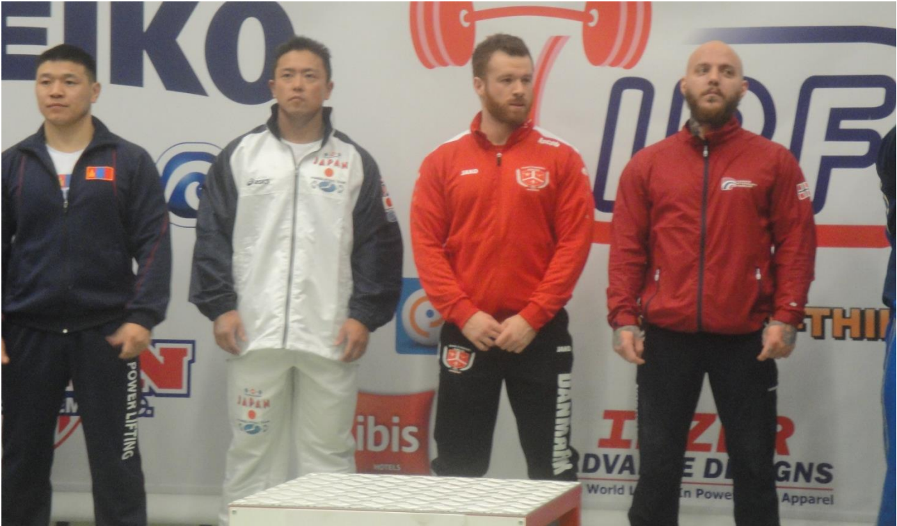
Efterfølgende kunne vi samles til det obligatoriske holdbillede, denne gang taget af den polske træner, hvor vi står knivskarpt i vores nye landsholdsdragter.