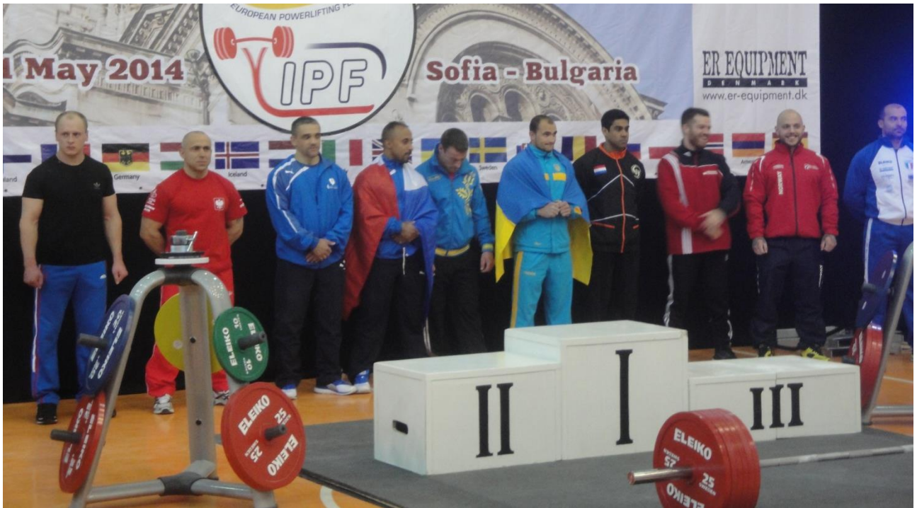
Fredag den 9.maj Guld til den hvide haj & dansk rekord til den vrede tømmer.